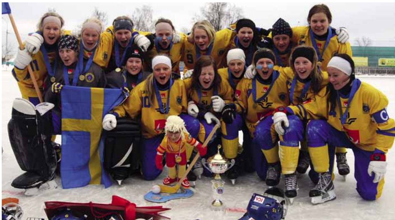
F 17-landslaget – Världsmästare 2011.