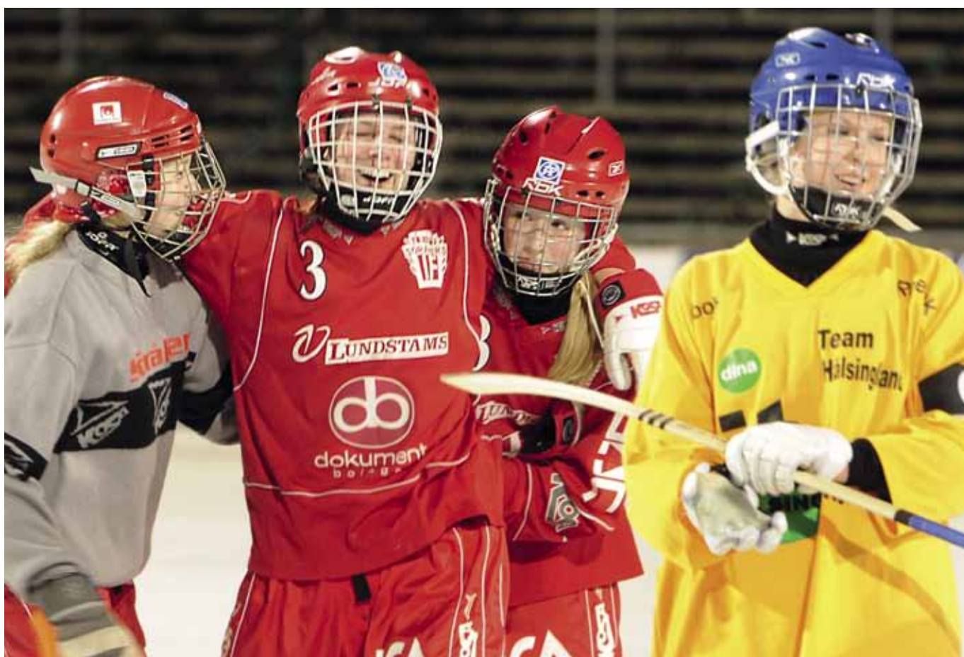
Glädje i Söråker sedan man finalbesegrat Team Hälsingland i F17-finalen.