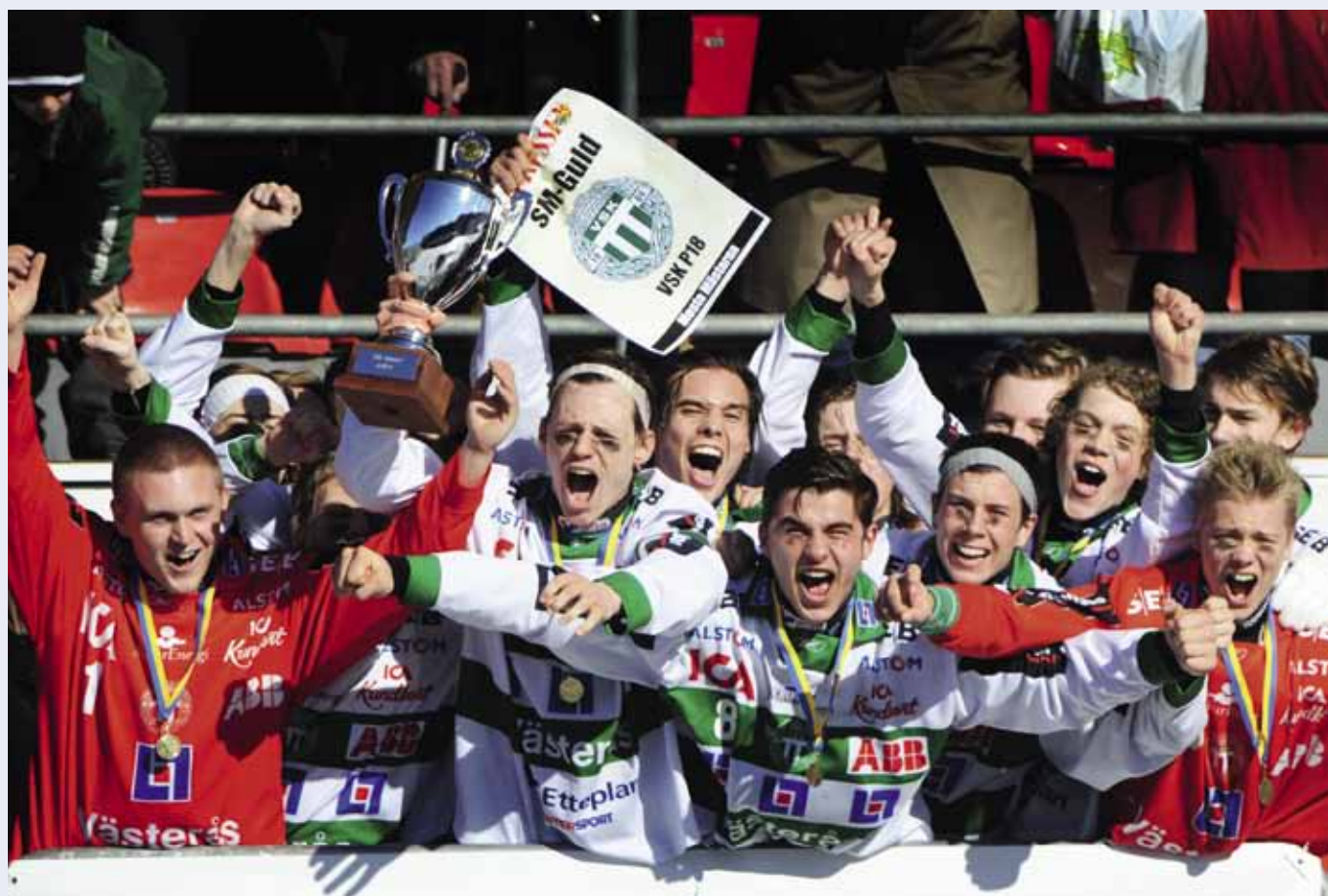
Västerås SK jublar sedan man besekrat Vänersborg med 9-3 i P18-finalen på Studenternas.