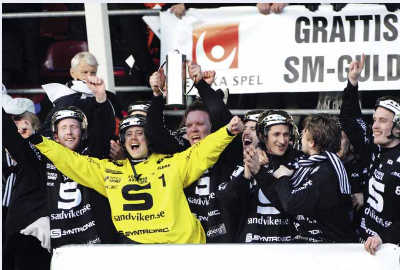
Sandviken jublar efter finaltriumfen mot Bollnäs.